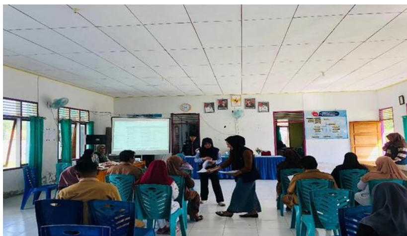
Gambar 1. Penyuluhan tentang Bahaya dan Etika Merokok

Dokumentasi kegiatan adalah sebagai berikut :