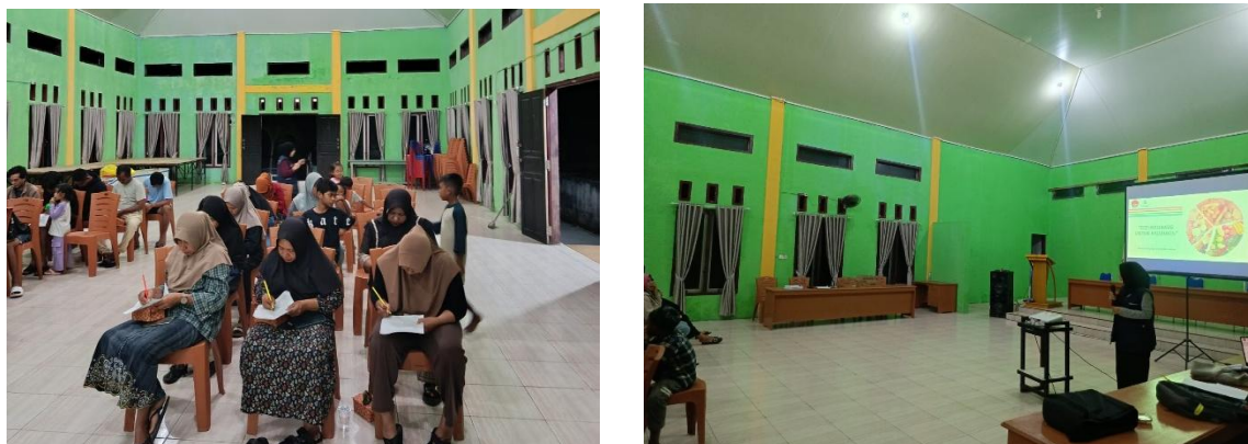
Gambar 1 & 2 Penyuluhan Gizi Seimbang Pada Keluarga

Dokumentasi kegiatan adalah sebagai berikut :